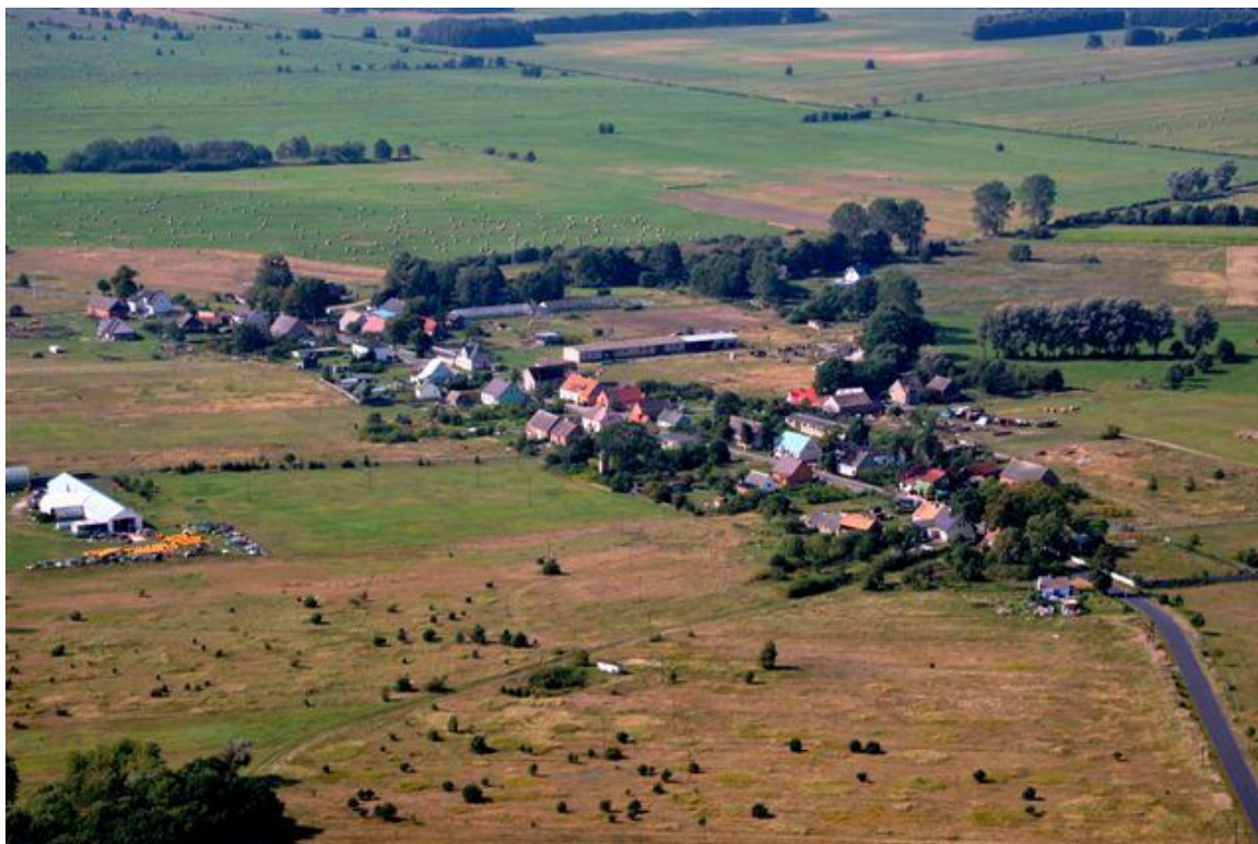
Miłowo z lotu ptaka