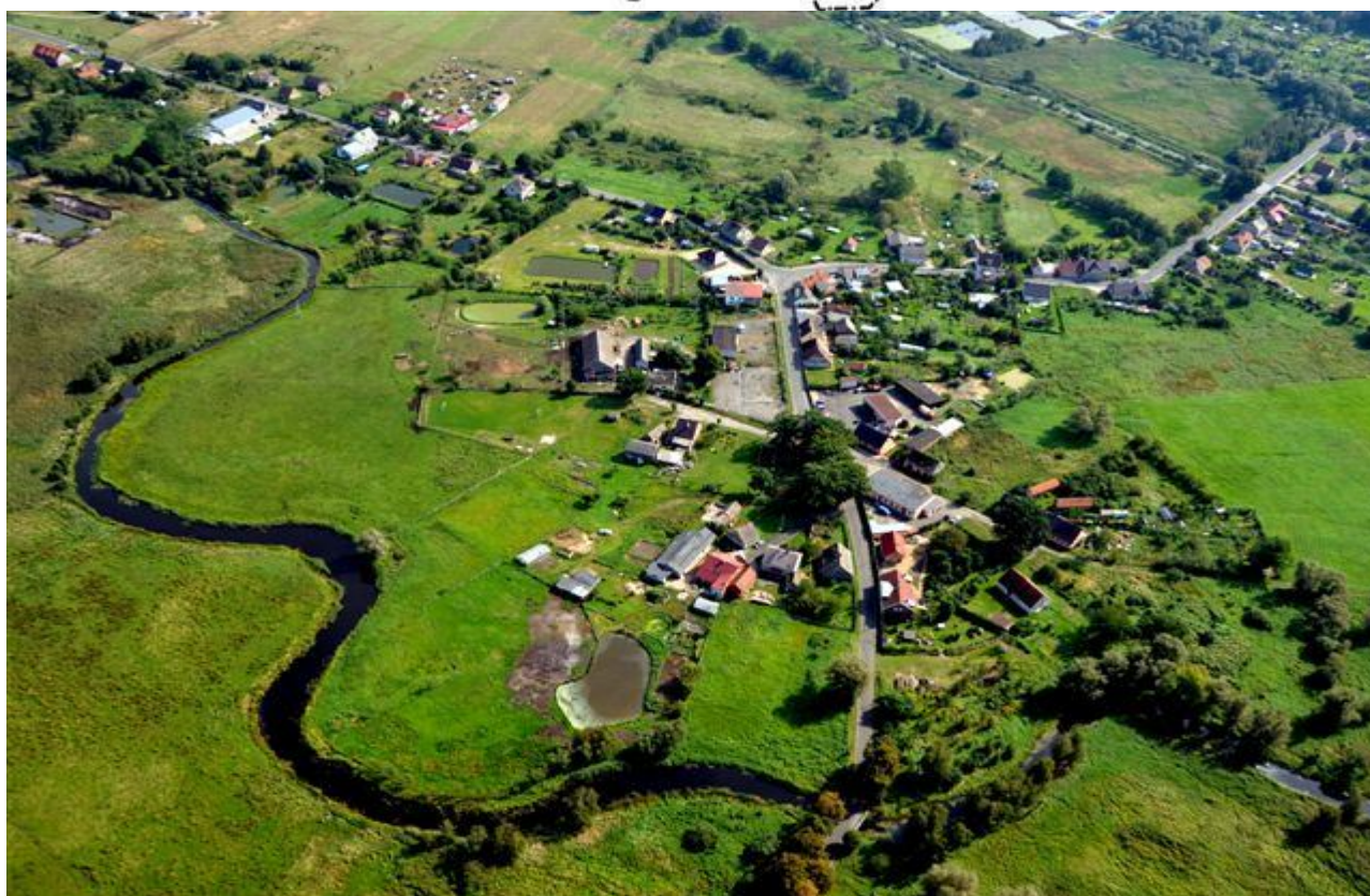
Stepniczka z lotu ptaka