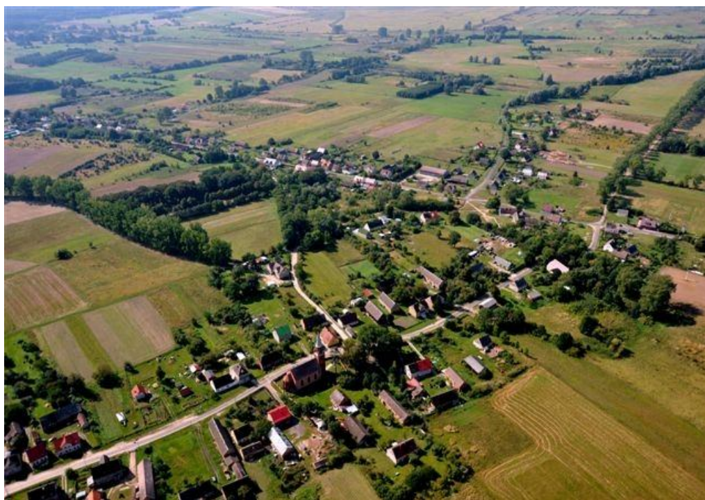
Żarnowo z lotu ptaka