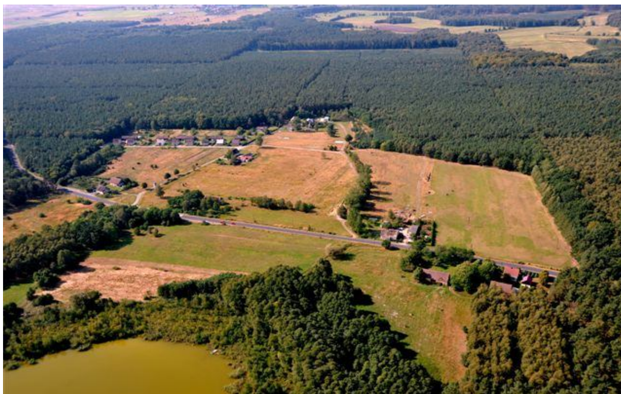
Zielonczyn z lotu ptaka