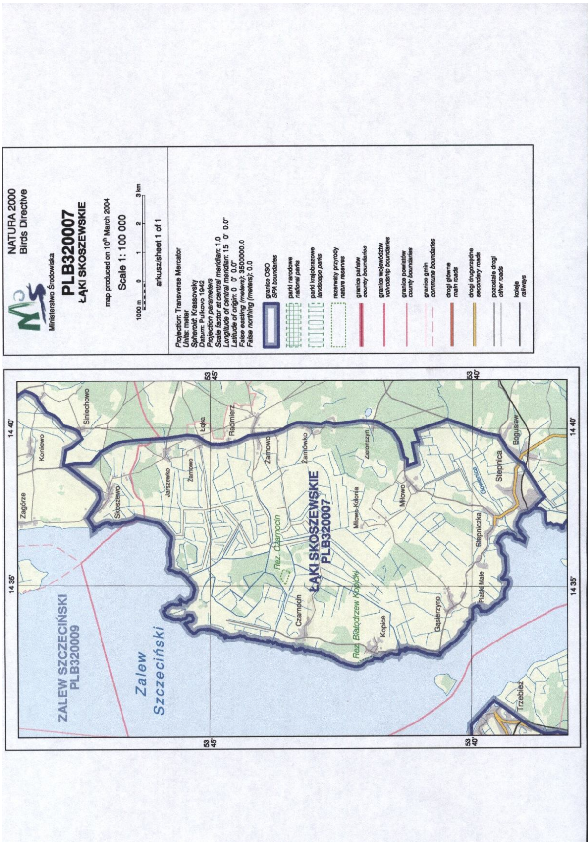
Ryc.1 Zasięg programu Natura 2000 „Łąki Skoszewskie”