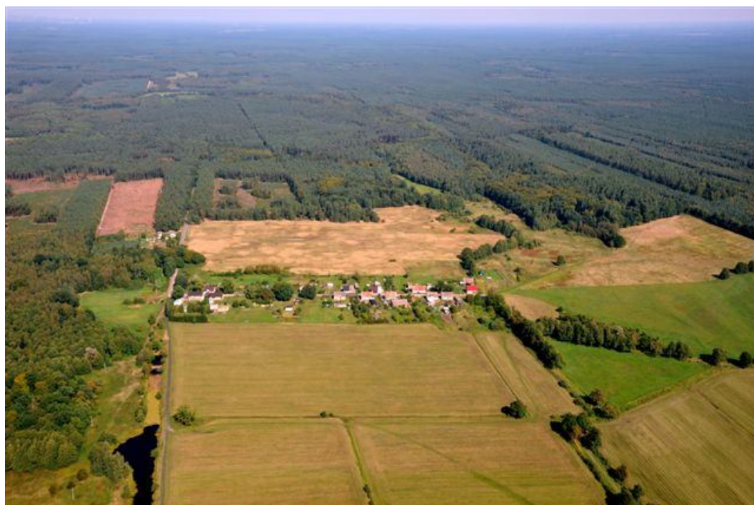
Budzien z lotu ptaka