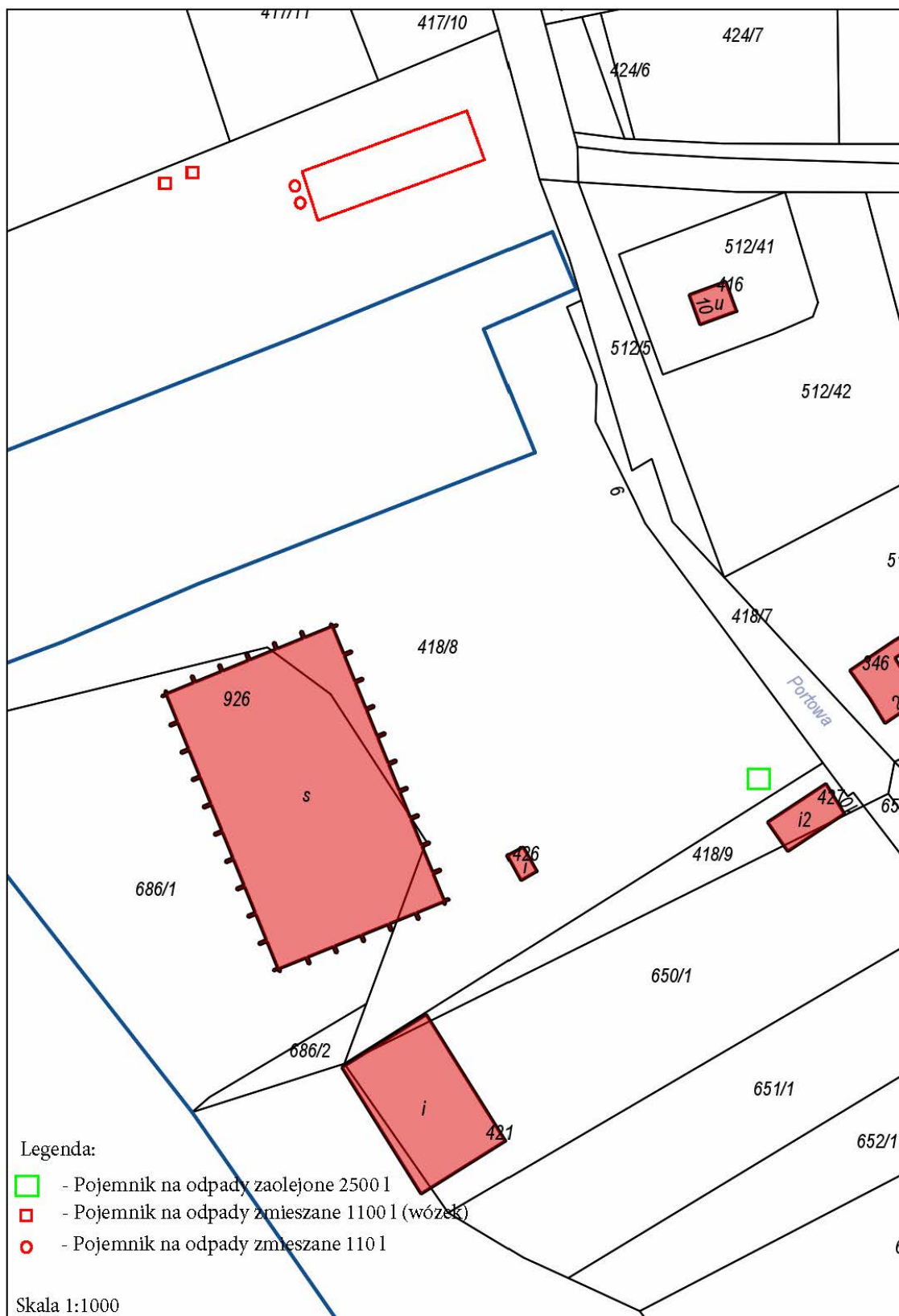
Ryc. 3 Rozmieszczenie urządzeń na nabrzeżu Basenu Przeładunkowego (Kolejowego)