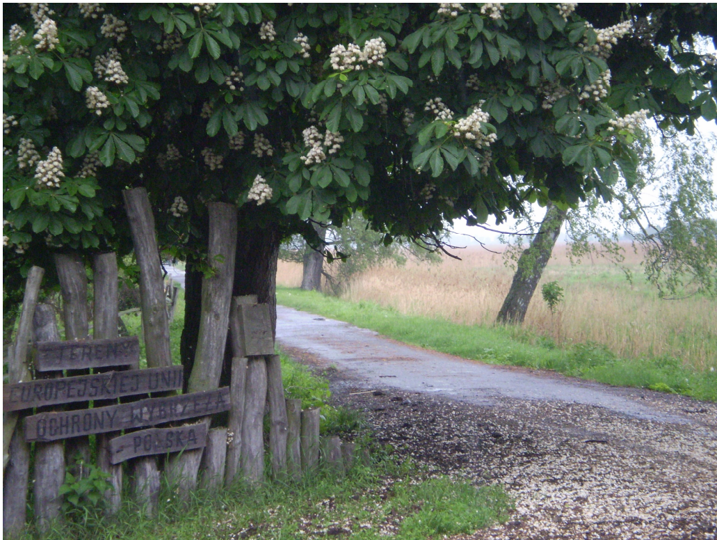
Fot. 2 Wejście na teren Parku Natury Zalewu Szczecińskiego umiejscowionego w pobliżu Czarnocina.