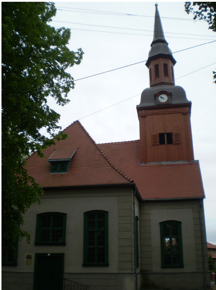
Fot. 1 Kościół w Stepnicy